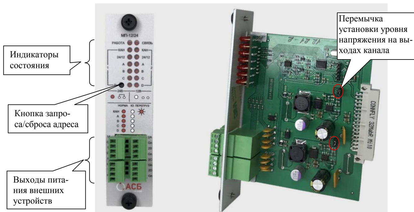
Рисунок 1 - Передняя панель МП-12/24

Вид передней панели МП-12/24 – в соответствии с рисунком 1. Общий вид МП-12/24 – в соответствии с рисунком 2.